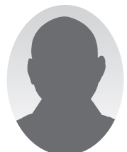
〈所属仏青〉 氏名 常任委員会(◎委員長 ○副委員長)